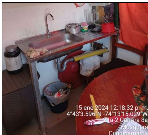
Ilustración 5. Punto 1 vertimiento ARD

En el primer punto, se evidenció tubo de descarga de aguas residuales domésticas al suelo procedentes del lavaplatos de la caseta de vigilancia.