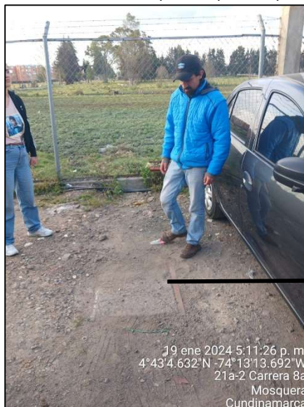
Ilustración 8. Ubicación posible pozo séptico

Las personas que atienden las visitas, manifiestan que el predio no está conectado al sistema de alcantarillado público, toda vez que no hay cobertura por parte de las empresas prestadoras, por lo tanto, cuentan con pozo séptico, sin embargo, no fue posible su inspección, ya que se encuentra tapado.