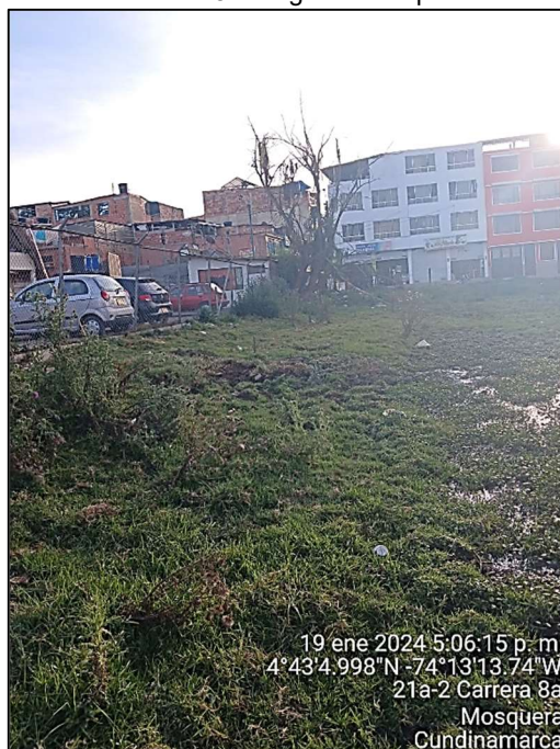
Ilustración 8. Anegación del predio