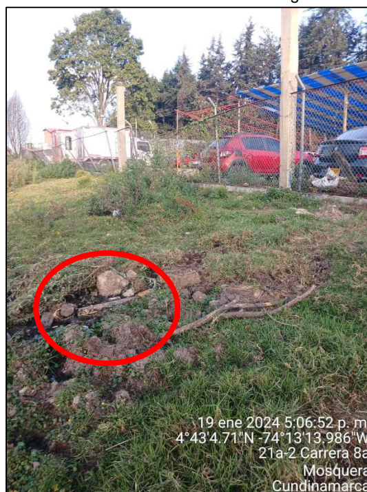
Ilustración 6. Punto de descarga 2

En el segundo punto, se identificó tubería de descarga al suelo, observándose anegación del terreno en la boca del tubo y percepción de olores característicos de aguas residuales.