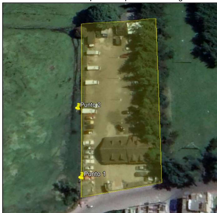
Ilustración 4. Ubicación puntos de presunta descarga de ARD

En el primer punto, se evidenció tubo de descarga de aguas residuales domésticas al suelo procedentes del lavaplatos de la caseta de vigilancia.